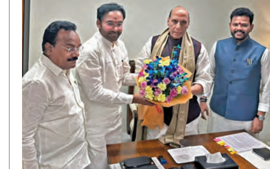
బుధవారం న్యూఢిల్లీలో రక్షణ మంత్రి రాజీనాథ్ తో భేటీ అయిన కేంద్రమంత్రులు కిషన్ రెడ్డి, రామ్మోహన్ నాయుడు

తెలిపారు. రాష్ట్రంలోని విద్యార్థుల సంఖ్యలో హైదరాబాద్ నగరంలోనే 44 శాతం ఉన్నారు, వారికి నాణ్యమైన విద్య అందించాలని భావించిన మన అందరినీ ఉండవలసిందిగా కోరుకుంటున్నామని సీఎన్ఆర్ నిధులలో ఎక్కువ మొత్తాన్ని అదే ప్రాంత అభివృద్ధికి కేటాయించాలన్నారు. సీఎన్ఆర్ నిధుల వినియోగంలో ఇప్పటి వరకు సరైన విధానం లేనందున తాము ఒక ప్రత్యేక ప్రధాన కార్యదర్శిని ఇందుకు నియమించామని సీఎం తెలిపారు. కంపెనీల ప్రతినిధుల ఆయనతో సమన్వయం చేసుకొని తమకు ఆసక్తి ఉన్న విద్యా, వైద్యం, జల వనరులు, వైపుణ్య శిక్షణ, వాహనాల కట్టడాల వరకు అవసరమైన సహకారం అందిస్తామని సీఎం తెలిపారు. ఇప్పటికే రూ.50 కోట్లు, రాష్ట్ర ప్రాంత రూ.50 కోట్లు, యశోద ఫౌండేషన్ రూ.10 కోట్లు విద్యార్థులకు కేటాయించేందుకు ముందుకు వచ్చాయని వారికి సీఎం అభినందనలు తెలిపారు. కంపెనీల ప్రతినిధులు స్పందిస్తూ